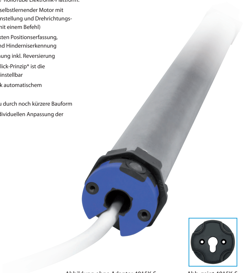
Abbildung ohne Adapter 4015K-S