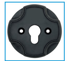
Abb. zeigt 4015K-S