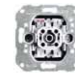
VK 2665-WE Wipptaster-Einsatz, Schließer 1-polig