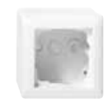
VK 2664-1-UW Gira System 55 (Serie Standard 55) Aufputzgehäuse, 1-fach, ultraweiß