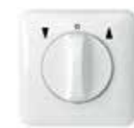
VK 2780-UW Jalousieschalter, UP, beidseitige Tast- und Rast- funktion, 1-polig, ultraweiß