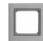
VK 2660-AL Gira System 55 (Serie E2) Abdeckrahmen inkl. Zwischen- rahmen, 1-fach, aluminium