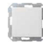
VK 2666-WS-UW Gira Wechselwippe, ultraweiß