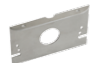
VK 2128-AL Deckenmontage-Winkel für ArtMotion, aluminium