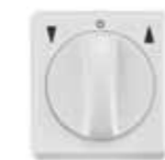
VK 2784-UW Jalousieschalter, AP, beidseitige Tast- und Rast- funktion, 1-polig, ultraweiß