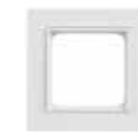
VK 2660-UW Gira System 55 (Serie E2) Abdeckrahmen inkl. Zwischen- rahmen, 1-fach, ultraweiß