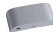
VK 2127-AL ArtMotion Radar Bewegungsmelder, aluminium