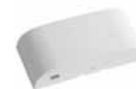
VK 2127 ArtMotion Radar Bewegungsmelder, weiß