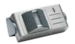
VK 2122 Funk-Bewegungsmelder, batteriebetrieben, aluminium