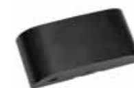
VK 2127-SW ArtMotion Radar Bewegungsmelder, schwarz