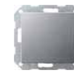
VK 2666-WS-AL Gira Wechselwippe, aluminium