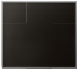
4751 Solarmodul m. Laderegler in Verbindung mit Art. RP-S3A-400N-D40 / -D45, Maß: 330 x 293 mm, Gew.: 1,6 kg, inkl. Montagew. u. 8 m Anschlußk.