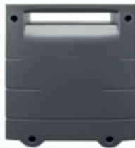
4752 RolloPort S3 – Wechselakku, Außenmaß: 165 x 193 x 80 mm, Eingang 230 V