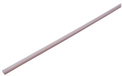
3730 Mini-Kabelkanal selbstklebend, transparent, Länge 2,0 m, passend für 3893 / 3895